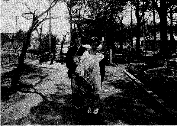
図4-12 初 宮 詣 り

女の子だと女兒が生まれるとのいつたえがある。 「里帰り」、出産予定の七、八日前に赤飯をたずさえ在所に帰り出産にそなえた。昔から第一子は里（在所）で出産する習わしがあった。出産のことを「ヨロコビ」とよんだ。