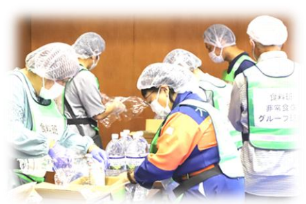
食料班：非常食分配

協力組織：大口北小学校、大口中学校、大口西小学校、丹羽消防署、自衛隊 丹羽広域事務組合水道部、大口町消防団・北地域各分団・予防啓発団、 大口町社会福祉協議会、まちなっと大口、地域包括支援センター、 さくら総合病院、尾北看護専門学校、D・サポート丹羽、大口町災害救援ボランティア トヨタカローラ愛知大口店、トヨタ大口部品センター、メガコンコルド 1177