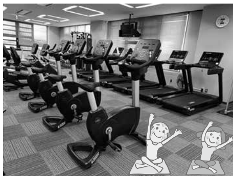
▲トレーニングセンター