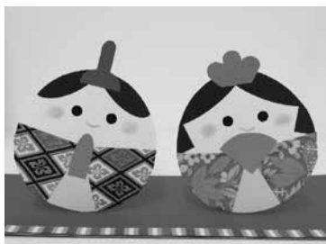
▲「ころころおひなさま」作成例