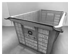
▲スプレー缶専用カゴ

また、スプレー缶およびカセット式ガスボンベは、 中身を完全に使い切った状態で、穴をあけずに排出 してください。缶の素材で分別する必要はありません。