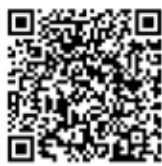
あいち救急医療ガイド