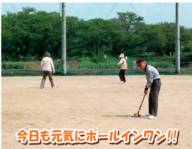
今日も元気にホールインワン!!