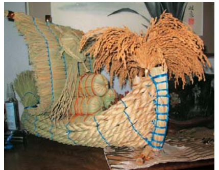
玄関に置かれているわら細工の宝船。 制作に4日かかったそうです