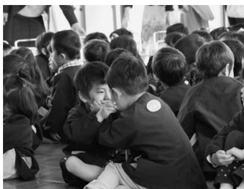
ほっぺをつねって、にらめっこ。仲良しの分だけ感染率もアップアップ？

問 加湿器の使用基準はあるか。 答 基準は定めていない。各部屋の環境に合わせて、担任あるいは園長の判断で使用していく。