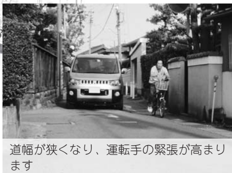
道幅が狭くなり、運転手の緊張が高まります