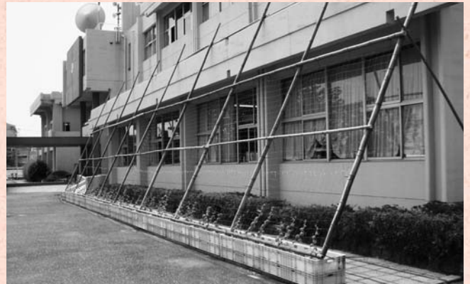
今年も設置された緑のカーテン

先ごろの こっぴ 口蹄疫でも見られるように、住民が行政に望むことは危機管理対策が万全であること。新型インフルエンザも脅威がなくなったわけではない。危機管理マニュアルを作成し、十分な訓練・準備をお願いしておきたい。