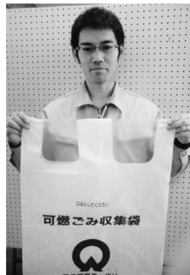
ごみ袋の結びしろは復活です

答 22年度の入札単価は、大袋4・35円(21年度10・87円)、小袋3・33円(同9・29円)、減量型1・73円(同4・83円)と大幅に下がった。