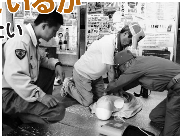
丹羽消防署員に心臓マッサージとAEDの使用方法を教わる住民=9月4日、大口町防災訓練で