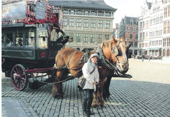
フランダースの犬で有名なアントワープの広場

に乗りたい一心でリハビリに励み、半年後には仕事に復帰。再び乗馬もできるようになりました。