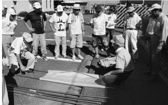
物干しざおと毛布で担架が完成