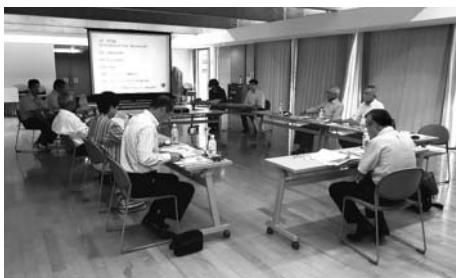
スライドを見ながら説明を聞く委員＝勝山市