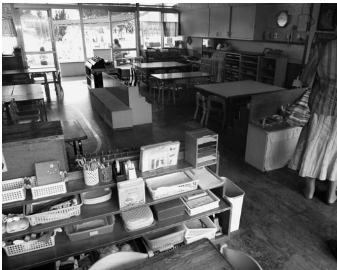
整理棚で仕切っているだけ。フロア全体が見渡せます ＝つぼみ保育園

文教福祉常任委員会は保育の先進地事例を学ぶため、9月29日と30日に福井県坂井市と勝山市を訪問しました。