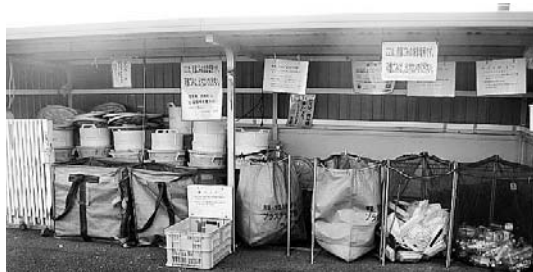
整然と分別されている河北の常時回収

宮田 河北地区では段ボール・雑紙・ビニール類・ペットボトル・トリーなどの常時回収を行っている。河北地区の取り組みをどう見ているか。