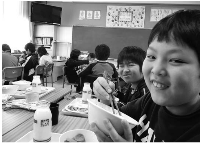
(上)4年2組の児童ら (左)当日のメニュー

文教福祉常任委員会は12月9日、大口北小学校の4年生と6年生のクラスに分かれて学校給食を試食しました。