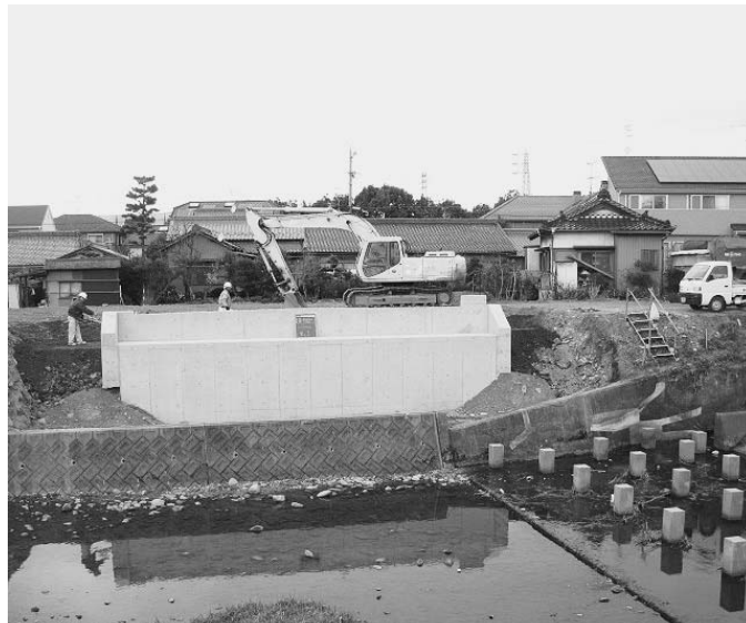
建設中の大口橋=上小口三丁目

答 大口橋は北小学校の通学路になっている。23年度予算だと完成が24年になってしまう。今の時期は橋けたの発注件数が少なく、製作期間が1カ月半ほど短縮できるし、