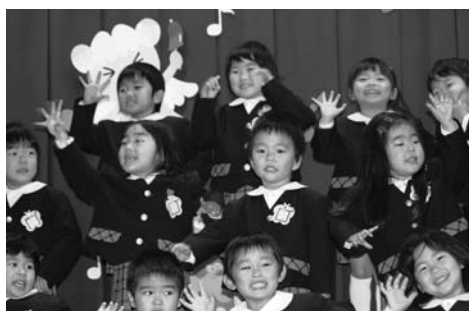
ラ・モーナ幼稚園 クリスマス・パーティ