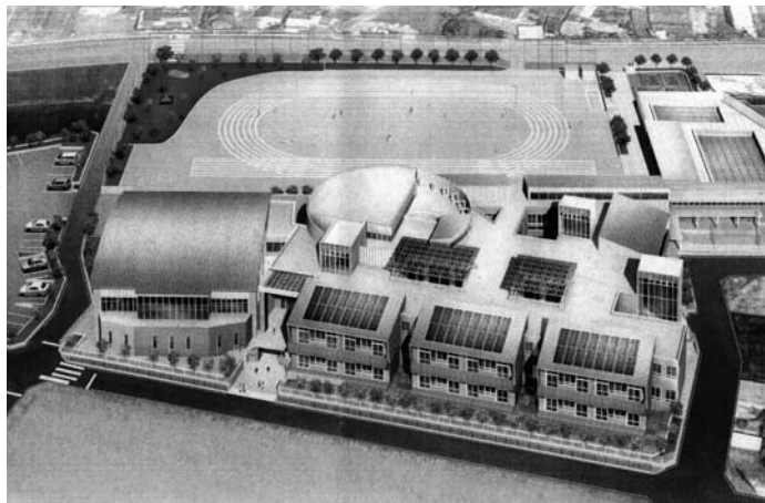
南小学校の全体イメージ図。左側の建物が体育館

南小学校建設特別委員会が新設する体育館の床面高を検討した結果、学校敷地東南角の道路レベル(設計G1)と体育館の床レベルを合わせることで決着しました。 当初の設計案では、設計G1から1メートル下げる予定でしたが、体育館の屋根形状や配置を見直すことで、日影の問題を最小限にとどめることができることになり、設計案を変更することになりました。 2月中旬に工事の入札があり、24年3月の完成を目指します。