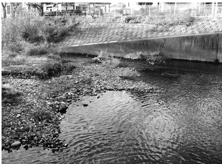
水深が浅く、むき出しとなった土砂