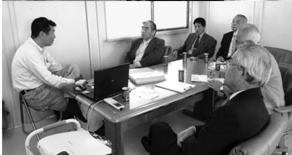
(上) 出荷を待つチンゲン菜 (下) 丁寧な説明を受ける議員