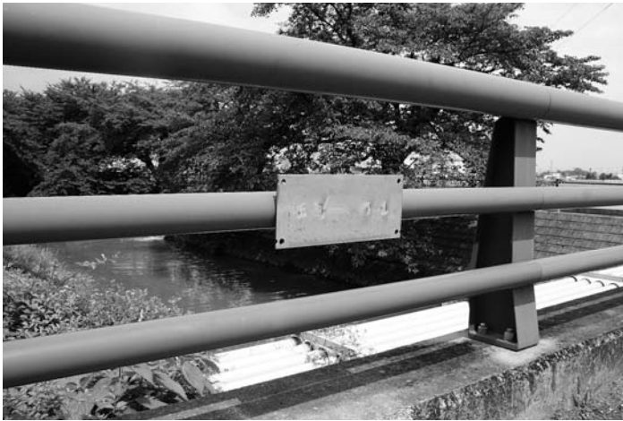
新田（あらた）橋の欄干に残った橋名板の台座。県管理分を合わせると、大口町内で7橋が「名無しの権兵衛」橋に？

問 橋の名前を記した橋名板が盗難に遭ったため、新たに作り付ける費用として110万円計上する。当初予算50万円との兼ね合いはどうなっているか。 答 当初予算の50万円は、当て逃げなどで橋が危険な状態になった場合の緊急処置的な予算。そのため、この50万円は使わな