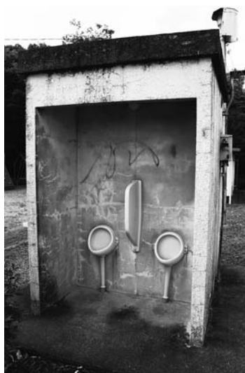
躊躇なく、使用できますか？

仮に接続するとしても区域外流入となるため、他の下水道整備計画にあわせて整備を考えたい。