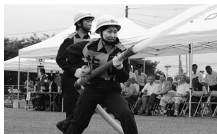
女性団員も小型ポンプ操法大会に出場

問 消防団員の退職報償金は、なぜ6月議会の補正予算になるのか。年度末に退団なら、もっと早く支払うことはできないのか。