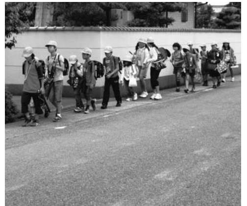
足元のところどころに白線の名残が...

ガードパイプなどの道路維持管理事業も含めると、工事件数・金額とももっと多かった。