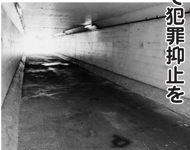
国道41号を横断するトンネル。車が通ることはないので交通事故の心配はないが、人通りが少ないので大人でも1人はちょっと不安