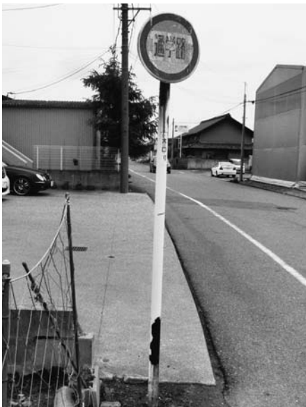
ペンキが薄れてしまってよく見えないが「通学路」と書いてあるようだ