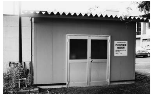
中央公民館南側の保管庫