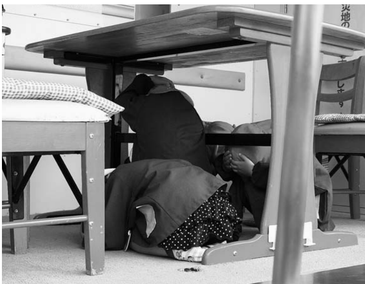
地震体験車「なまず号」で震度6弱を体験。先生に言われたとおり、机の下に隠れて頭をおおう園児たち＝5月10日、中保育園

江口氏は平成23年9月30日に任期満了となるため、議会の同意が求められたものです。