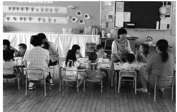
児童と園児がいっしょに昼食。休日保育が始まりました。 =7月3日 中保育園にて

健康福祉部長 ①既に日までを期限として、申込書を受け付けている。 ②職員は時間前には来ているので、若干のことは対応可能。現状、8時半で対応できている。