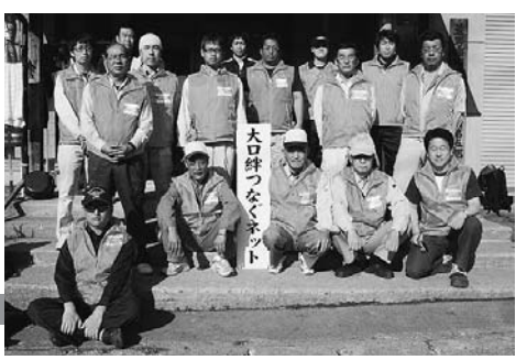
大口絆つなくネットのみなさん

今回私たちが訪問した目的は、支援活動拠点の確認及び支援活動の状況把握、被災地の状況視察、さらにはその支援で頑張る職員やボランティアの方への激励、そして、寝食でお世話になっている遠野市の方々へのお礼でした。