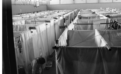
白布で間仕切りされた避難所＝大槌高等学校体育館