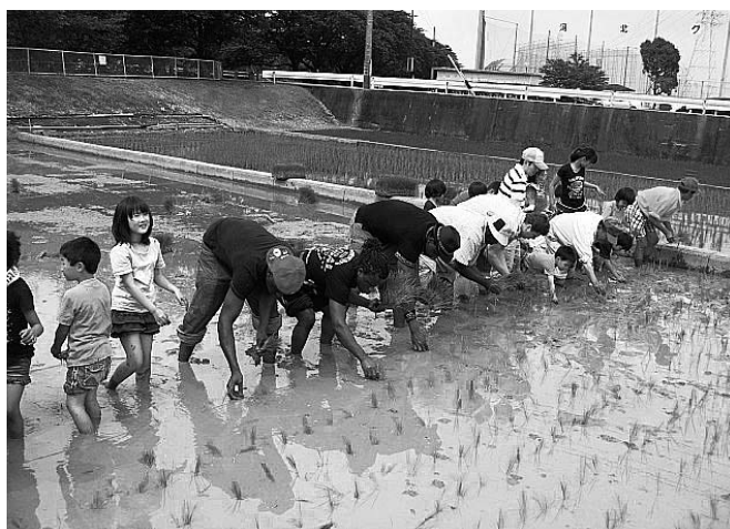
国際交流事業で田植えを体験したナイジェリアの人たち =6月19日、「河北エコ・リサイクルの会」が主催

答 この基金は、あいち万博の「1市町村1国フレンドシップ事業」の理念を継承・発展させ、市町村が行う国際交流事業