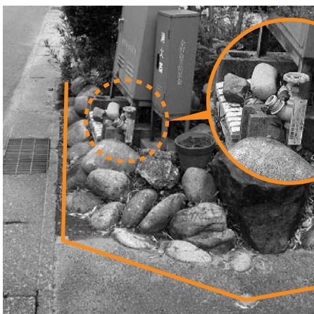
民地内にある簡易消火栓

として、町が3分の2を負担していた。現在は補助金を一本化し、行政区に、その権限と財源を移譲している。住民主体による取り組みを目指しているので、各行政区で優先順位を判断して、必要な整備を行うしてほしい。