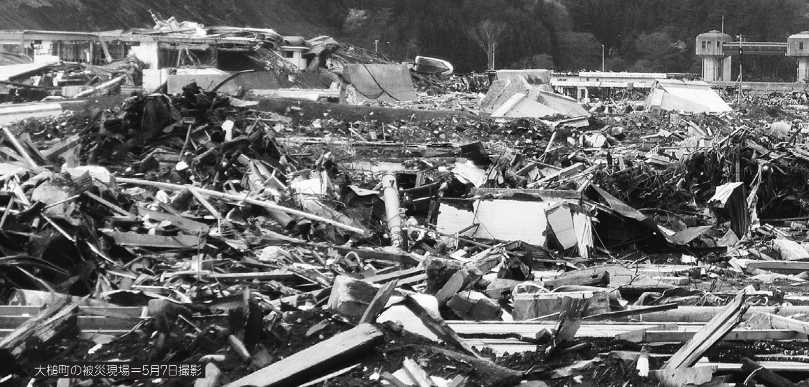
大槌町の被災現場＝5月7日撮影