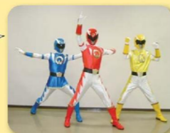
おおぐち元気戦隊ダッシュマン