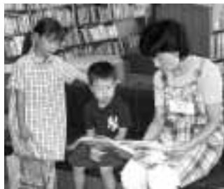
「おはなしエプロン」のようす

子どもたちは、読み手との1対1のふれあいの時間を持つことにより、言葉の数を増やし、自分の感じていることや、感性を言葉で表すことができる「日本語力」を自然に身に付けていきます。