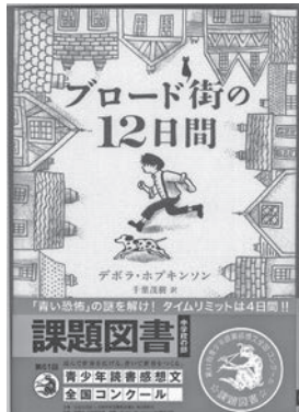
▲ブロード街の12日間