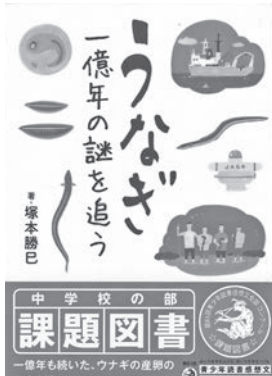
▲うなぎ一億年の謎を追う