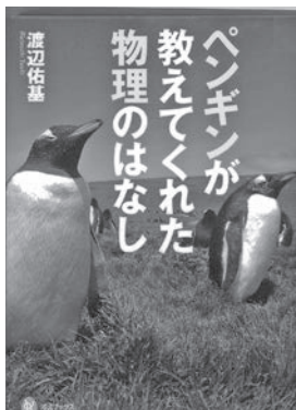
▲ペンギンが教えてくれた物理のはなし