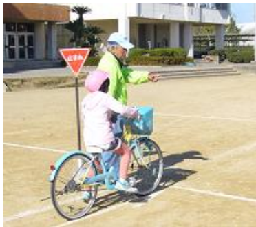
「右見て、左見て、後ろ見て」 しっかり安全確認!

この日は、江南警察署、名鉄自動車学校の皆さんや、中地域の皆さんが先生となり、子ども達に、自転車の乗り方や安全に道路を走行するポイントを伝えました。