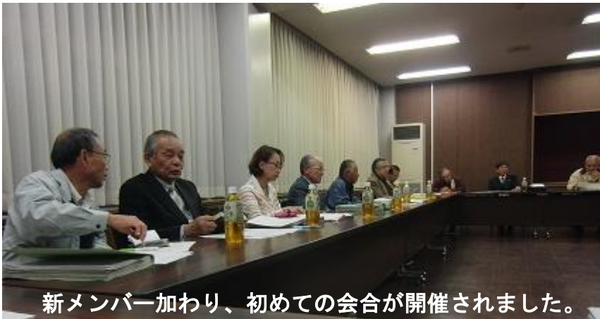
新メンバー加わり、初めての会合が開催されました。