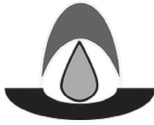
愛知県での特定都市河川浸水被害対策法に関する取り組みのシンボルマーク

このシンボルマークは、雨のしずくを受け、水を貯め、緑をはぐくむことをイメージしたものです。