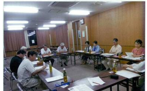
▲下小口地区の様子