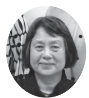
▲高齢者福祉協力員 会長 長子 本社会員

私たち高齢者福祉協力員15名は、在宅で生活している要介護認定者やその介護者を支えることを目的に訪問活動をしています。情報提供や介護に関する相談を受け、町や地域包括支援センターと連携し、高齢者福祉の向上に努めています。