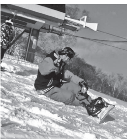
▲大学時代、高鷲スノーパークにて

今一番熱中しているのはスノーボード。今年は自前のボードを買ったので、冬休みになったらすべりに行くのが楽しみです。レンタルのボードは底面のカーブがないので今までジャンプができませんでした。カーブのあるボードを買ったので、今年はジャンプに挑戦したいです。すべるのが楽しいだけでなく、疲れて座っているときの景色もとても美しいので、ボードは大好きです。