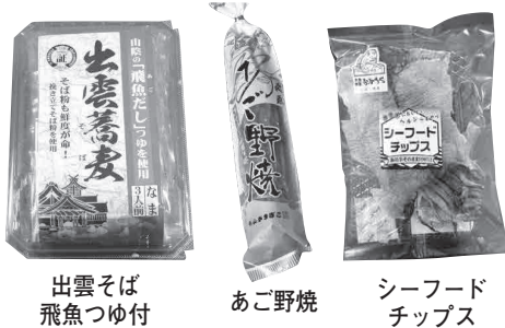
出雲そば 飛魚つゆ付