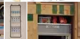
NHK 放映 実大試験