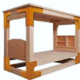
シングルサイズ用