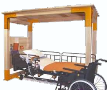
介護ベッド用シェルター