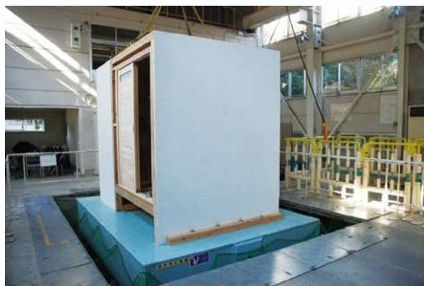
振動実験における装置全景