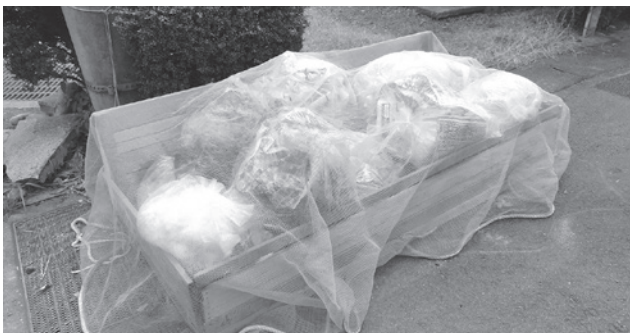
▲かごなどを使用し、ネットをかぶせる