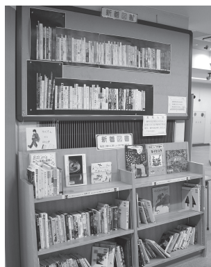
新着図書コーナー 毎週土曜日に新しい本が並びます。

年間貸出冊数 ..... 23万6,321冊 リクエスト数 ..... 514件 パソコン検索利用件数 ●館内検索機 (OPAC) 3万2,087件 ●インターネット検索 2万8,885件 ●携帯検索 ..... 58万8,422件