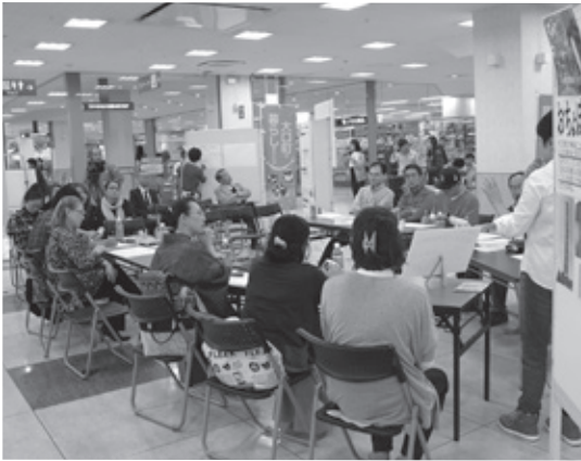
▲住民プロモーションチームメンバー