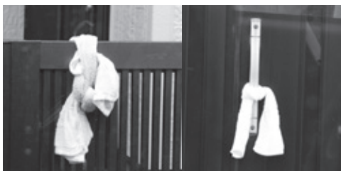
▲タオルを使った安否確認訓練