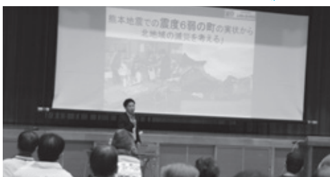
▲震度6弱の怖さをスライドで紹介