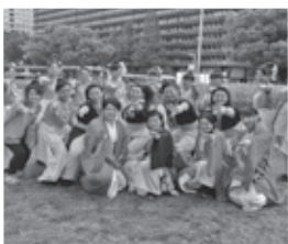
▲愛知江南短期大学 ～よさこいサークル飛鳥～ 去年、「どまつり」に出演!

今保育園の子どもたちの間ではやっているのは、「ポケモン」より「ハリーポッター」。長いものを杖に見立て、魔法の呪文「エクスペクトパトローナム!」と言って遊んでいます。小さい子どもたちが、難しい言葉をすべに覚えるので、びっくり。子どもたちは、いつも大人の想像しえないことをしてくれれます。