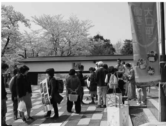
▲スタンプラリーでカードにスタンプを押す参加者（堀尾跡公園）