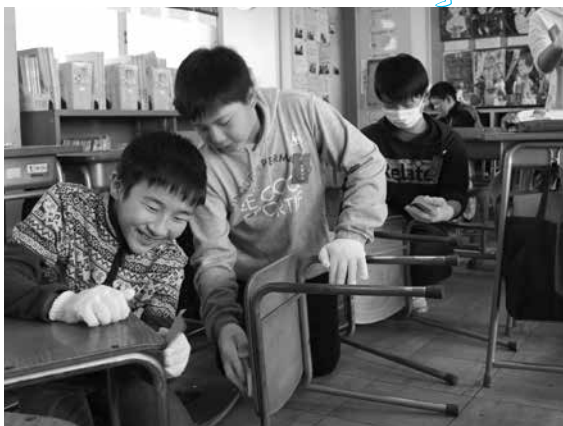
▲イスのやすりかけ