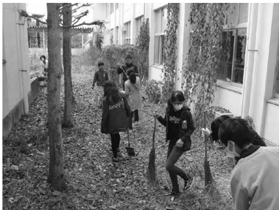
▲中庭の落ち葉掃除