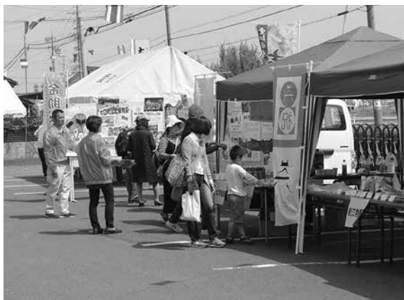
▲大和屋のスタンプラリー受付場所