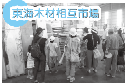
東海木材相互市場