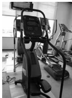
ステアマスター 下半身強化と有酸素運動