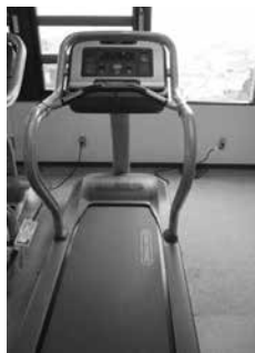
トレッドミル 効果的な有酸素運動