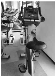
エアロバイク 効果的な有酸素運動