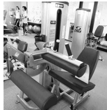
レッグエクステンション 太ももの筋肉強化と有酸素運動

初めて利用・申込みされる方は初回登録が必要です。利用カードを作成しますので、顔写真(3cm×2.5cm)をお持ちください。(未成年の方は保護者の印鑑が必要です)