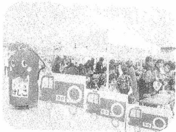
新聞紙で作る食器