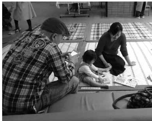
▲昨年のふれあいまつり「移動図書館」

子どもたちを対象にしたペーパークラフトと、日ごろは非公開の仕掛け絵本等の展示、絵本を親子で読むコーナーです。ぜひお立ち寄りください。