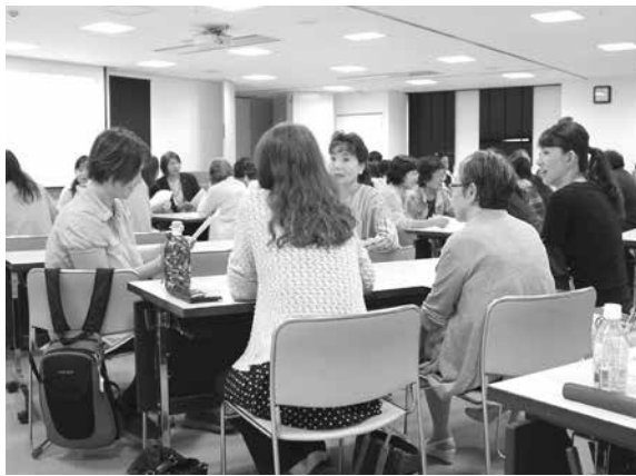
▲最近の「怒り」をグループワークで発表。怒りの度合いは人それぞれでした。

西保育園で、敬老の日を前に「祖父母交流会 父母の会イベント」がおこなわれました。 大好きなおじいちゃん・おばあちゃんが来てくれて、子どもたちは朝からニコニコと嬉しそう。じゃんけん遊びや触れ合い遊びなどをした後、遊戯室で「ピアノデュオGratoのピアノde音楽を楽しもう！」が開かれ、一緒に音楽鑑賞を楽しみました。 「普段と違う表情を見せる孫の成長が見れてよかったです」と参加者。