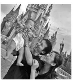
▲家族全員ディズニーラ ンド大好き!

さまざまな国出身のクルー がフライトごとに初顔合わせ。 会話はすべて英語で、訓練や ミーティングも英語でした。 同僚と出身国の文化や流行に ついて話したり、着いた先で 遊びに行ったり。毎日が新鮮 で、とても楽しかったです。 退職後は英会話教室の塾長に。 子育てが一段落したら、また 再開したいと思っています。